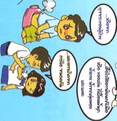
...หรือทำ ตัวเราด้วยตัวเรา