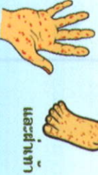
และฝ่าเท้า