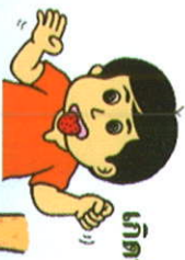
เกิดผื่นแดงที่ลิ้น

โรคมือเท้าปากเกิดจากการติดเชื้อไวรัสในกลุ่มเอนเทอโรไวรัส ซึ่งมีมากกว่า 100 สายพันธุ์ โดยสายพันธุ์ที่ทำให้เกิดโรคที่พบได้บ่อย เช่น คอกซากีไวรัส เอ16 (coxsackievirus A16) และเอนเทอโรไวรัส 71 (enterovirus 71) กลุ่มเสี่ยงที่พบบ่อยคือ เด็กทารกและเด็กเล็กอายุต่ำกว่า 5 ปี ซึ่งมักมีอาการรุนแรงมากกว่าเด็กโต สำหรับผู้ใหญ่พบโรคนี้ได้บ้าง